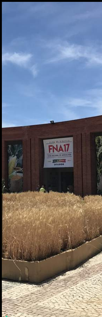
FNA Feira Nacional de Agricultura